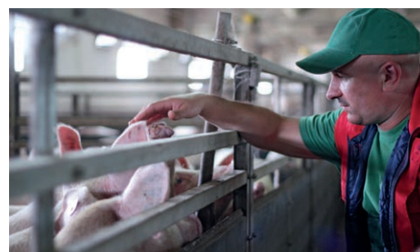
Vertrouwd met de agrarische sector.