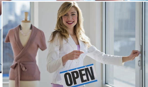
Maatwerk voor het MKB.