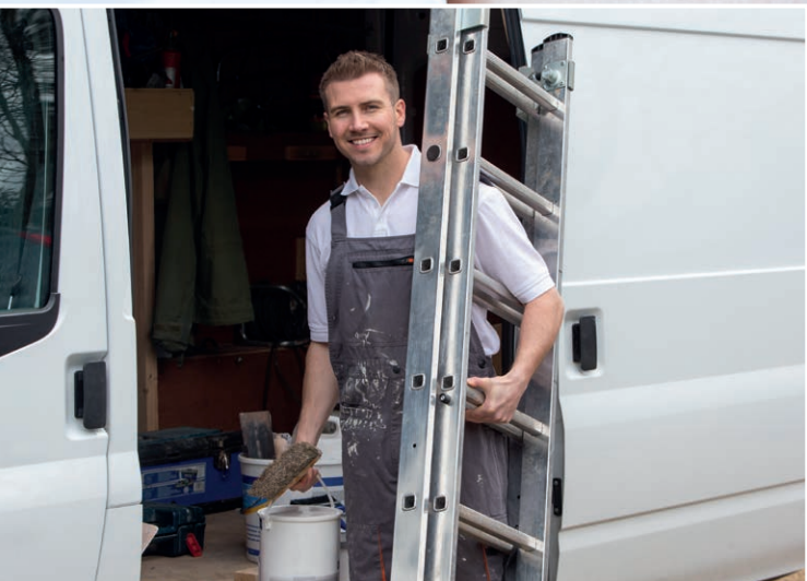
Ook betaalbaar voor ZZP'ers.